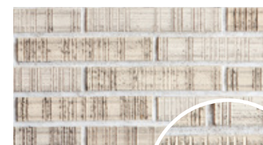
PR-6C 目地: DS07