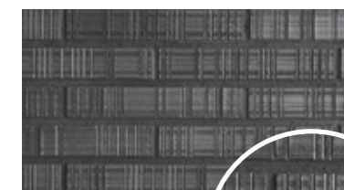
PR-7D 目地: DS10