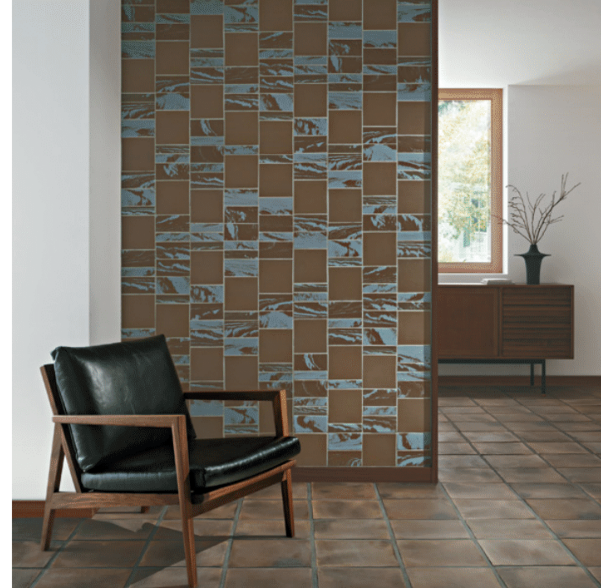
壁:FIR-GC 床:BISCUIT / Mano

建築家ならではの発想が息づいたクリエイティブなシリーズです。無釉のため耐久性も高く、住宅から店舗まで幅広くご使用いただけます。3形状の組み合わせで遊び心ある空間作りをお楽しみください。