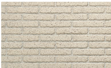
PE-LFB2-H (ミントグリーン) 目地:DS07